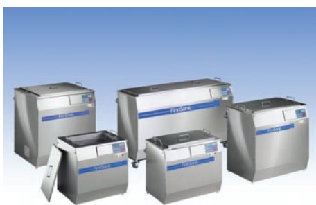
Cuves de nettoyage à ultrasons avec poche d'écrémage, dès 460 x 265 x 300 mm Système modulaire avec: • Cuves de rinçage, avec/sans chauffage • Circulation à haute pression, sécheurs • Séparateurs d'huiles, filtrés + systèmes de transports