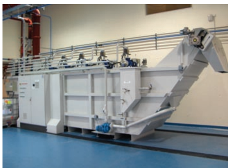
Installation centrale pour le traitement des liquides de meulages ou de machines d'usinage • Sans déchets de filtrés