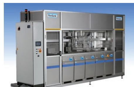
Machines de lavage à ultrasons, multi-bains • Automates avec chargement/déchargement et systèmes de transports multi-corbeilles • Maximum de sécurité de travail et réduction d'émissions par machines fermées • Constructions modulaires adaptées aux besoins