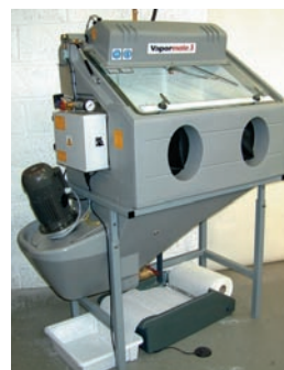
Sableuses à eau • Intérieur dès 700x700x600 mm • Ouverture sur le coté