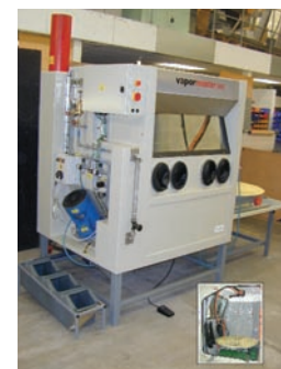
Sableuses à eau • Ouverture sur le côté • Intérieur dès 950x950x1330 mm