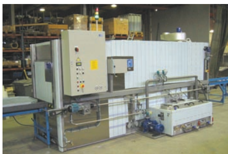
Machines de lavage à tunnel • Mono- ou multi-bains • Accès pour maintenance des filtrés à l'extérieur • Ecrémeur d'huiles, etc.