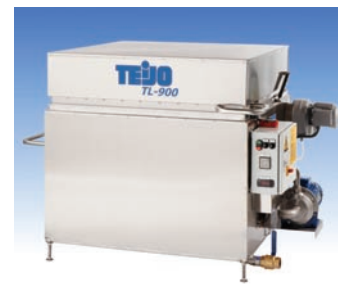
Machines de lavage à aspersion avec couvercle • Corbeille Ø 630, 850 + 1'150 mm • Charges jusqu'à 150 kg, • Filtrés, écrémeur d'huiles, etc.