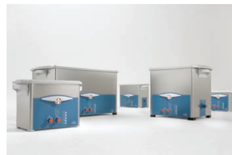
Cuves de nettoyage à ultrasons pour petites pièces • Cuves dès 190 x 85 x 60 mm • Avec booster & sweep