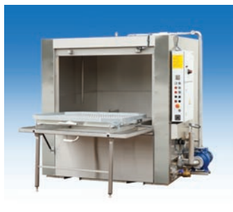
Machines de lavage à aspersion avec portes basculantes • Mono- ou multi-bains • dès Ø 700 mm • Filtrés, écrémeur d'huiles, etc.