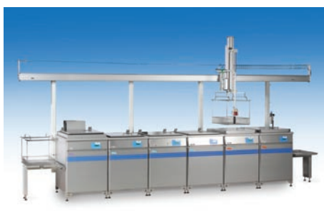
Machines de lavage à ultrasons, multi-bains • Maniements à mains • Systèmes d'aides transports pneumatique jusqu'à 50 kg • Transformations en automates ultérieur possible • Constructions modulaires adaptées aux besoins