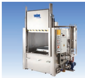
Machines de lavage à aspersion avec portes coulissantes • Mono- ou multi-bains • Systèmes de convoyeur • Filtrés, écrémeur d'huiles, etc.