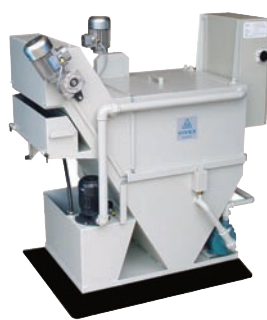
Filtre pour machines de meulage • Sans déchets de filtrés